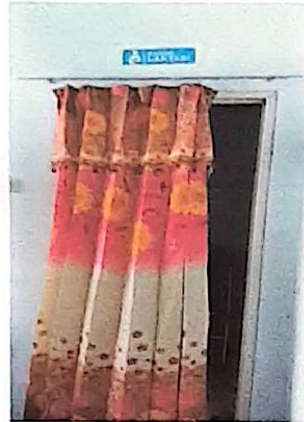
Ruang Ibu Menyusui /Laktasi